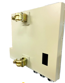
単管パイプ設置 (クランプ2点)